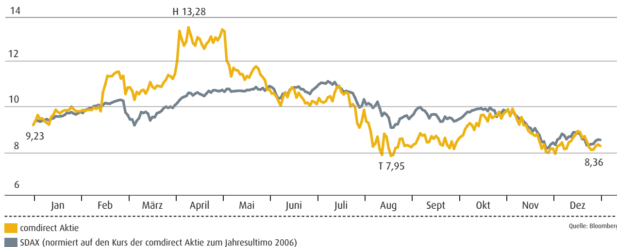
Kursverlauf der comdirect Aktie vom 29.12.2006 bis 28.12.2007 (in Euro)

Die comdirect Aktie zeigte im ersten Quartal eine sehr gute Performance und konnte die Vergleichsindizes hinter sich lassen. Im zweiten Quartal erreichte sie mit 13,28 Euro den höchsten Stand seit rund sechs Jahren. Im Anschluss an die Hauptversammlung kam es zu einer deutlichen Kurskorrektur, die im Wesentlichen auf den technischen Effekt des Dividendenabschlags zurückzuführen war. Bei einer Präsenz von 85,72% hatten die Aktionäre der Rekordausschüttung von 1,40 Euro je Aktie – einschließlich einer Sonderdividende in Höhe von 1,00 Euro – zugestimmt. Damit wurden im